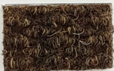
Serie Brizzolata MARRONE 47