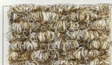
Serie Brizzolata CAPPUCCIO 46