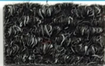
Serie Brizzolata NERO 42