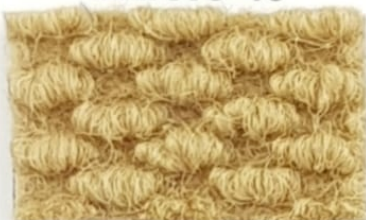
Serie Brizzolata CANAPA 43