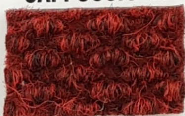
Serie Brizzolata BORDO' 49