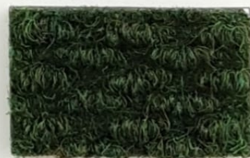
Serie Brizzolata VERDE' 51

Materiale intarsiabile anche con il Cocco Supreme