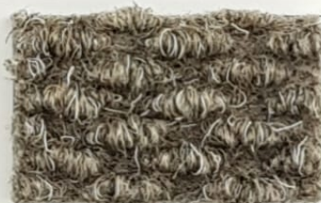
Serie Brizzolata VERDOGNOLO 48