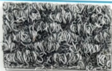
Serie Brizzolata GRIGIO 40