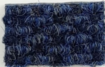
Serie Brizzolata BLU 50