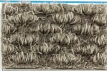
Serie Brizzolata SILVER 41